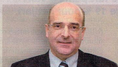
CIMENTS DU MAROC